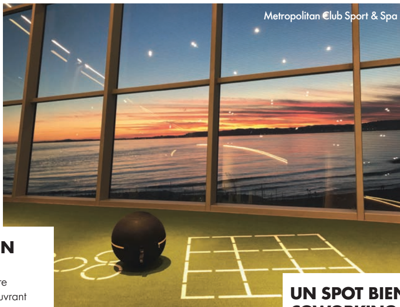
Metropolitan Club Sport & Spa

Mathilde pratique des soins de beauté vegan et biologiques à domicile. Pratique ! Pas besoin de se déplacer pour un massage, une manucure express ou une mise en beauté naturelle. Aujourd'hui, elle invente les BFF (Beauty Full Friends), des moments éthiques (zéro déchet) pour réunir ses ami(e)s le temps d'une journée sous le signe de la beauté et du bien-être. On choisit, par exemple, des soins à partager (manucure,