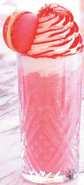
Café Pierre Hermé Paris